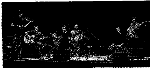
Componentes de la banda Batà, de Alcoi.

Ballet de Donetsk lleva a escena Otelo , una ópera en cuatro actos con música de Giuseppe Verdi y libreto de Arrigo Boito, a partir de la obra homónima de Shakespeare, estrenada en el Teatro de la Scala de Milán en 1887. La dirección musical y escénica correrán a cargo de Vasily Vasilenko e Igor