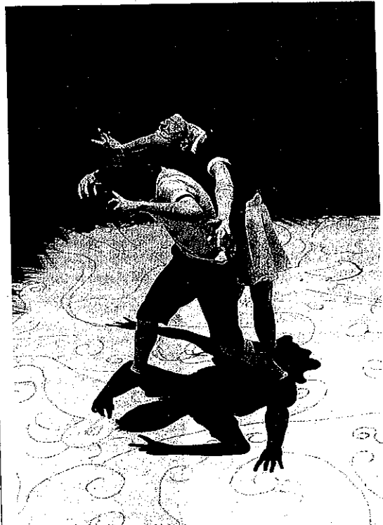
Representación de 'Ras'. ■ LP